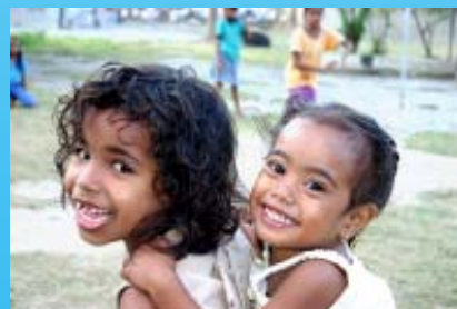
Wenn der Stärkere den Schwächeren trägt, werden in der Regel beide glücklich

Die miriam-stiftung ist eine gemeinnützige, rechtsfähige Stiftung bürgerlichen Rechts. Sie wurde 2003 in großer Dankbarkeit für die wunderbaren Jahre mit Miriam gegründet. Die Stiftung möchte mit dem, was sie von den Stiftern und Freunden der Stiftung an Mitteln empfangen hat und weiterhin an Förderung empfängt, andere, die es wirklich nötig haben, fördern und motivieren. Mit verschiedenen konkreten Aktivitäten sowie Mut machenden Gedanken und Texten in der Internet-Homepage möchte sie vor allem Menschen in Resignation und Ausweglosigkeit motivieren bzw. helfen, dass sie davor bewahrt bleiben.