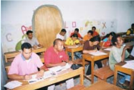
Unterricht im Haus Esperanca - Osttimor