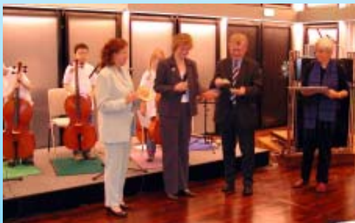
Verleihung des Musikförderpreises 2005 an die Cellogruppe "Die Regenbogenkinder" der Sächsischen Blindenschule Chemnitz

Die Stiftung legt sehr großen Wert auf eine verantwortungsvolle Verwendung der Erträge aus dem Stiftungsvermögen und den ihr darüber hinaus anvertrauten Spenden. Die sehr niedrig gehaltenen Verwaltungskosten werden ausschließlich durch die Stifter allein finanziert. Zuwendungen durch Freunde und Spender werden also in vollem Umfang – ohne jeden Abzug – im Rahmen der satzungsmäßigen Zwecke projektbezogen eingesetzt. Die Stiftung wird nur solche Projekte fördern, die ihr im einzelnen bekannt sind, die sie also selbst mit initiiert hat bzw. bei denen sie die ordnungsmäßige Verwendung der Gelder beobachten und kontrollieren kann.